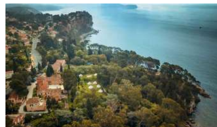
kelkaj bildoj pri la restadejo "Domaine de Massacan", kiu gastigos la staĝantojn.