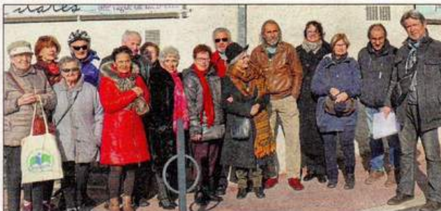
Les espérantistes ont célébré le 70 e anniversaire de la Déclaration universelle des droits de l'homme.

Il a donc été rappelé à tous que l'Universala Esperanto-Asocio (UEA), la principale association mondiale pour l'utilisation et le développement de la langue internationale espéranto, a inscrit dans ses statuts le respect des droits de l'homme comme condition essentielle pour son action, et qu'elle ne manque pas de souligner la concordance entre les efforts de Zamenhof, qui a consacré sa vie à la fraternité de l'humanité, et ceux des Nations Unies pour universaliser ces droits.